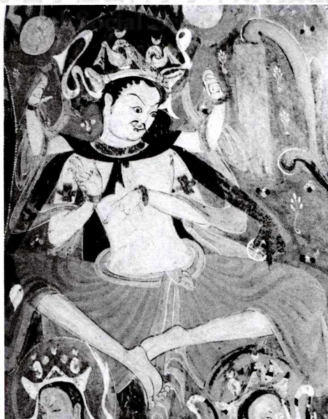
图四 敦煌第285窟中的那罗延天 ②

2006年5至6月新疆和田地区策勒县达玛沟托普鲁克敦2号佛寺遗址(建造时代可能为公元8世纪)出土了两块木板画,发掘者将其定名为“千眼坐佛木板画”。其中06CDF2:0027,木板上部绘一坐佛,结跏趺坐……坐佛以下为黑线绘出的九列眼睛,两列相对成为一对眼睛,中间为单独一列,每行为四对半眼睛。木板背部是一个佛的脸,额头左为月,右为日……鼻梁两侧共有七对眼睛,大而完整,睛瞳圆大。06CDF2:0028,上部为一坐佛,结跏趺坐……坐佛下部左边为月,右边为日。再下面为成对的眼睛,