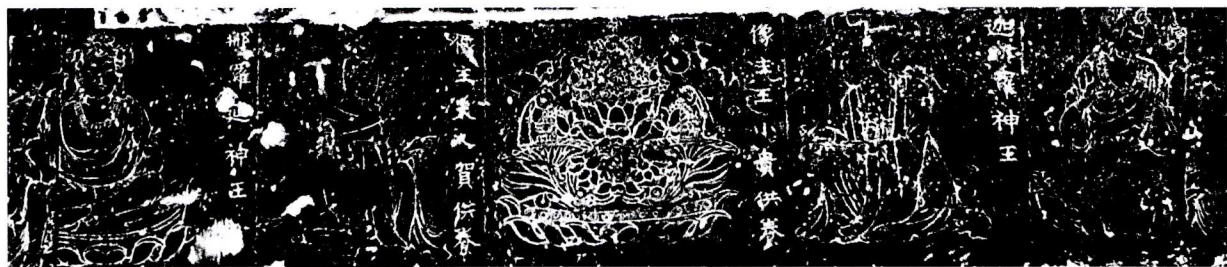
图五 邑主韩永义等人造像碑局部 ③