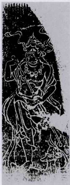
图六 少林寺唐代释迦佛塔上的 那罗延神王 ①