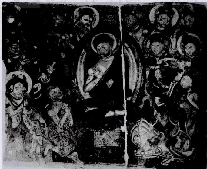
图七 克孜尔第 178 窟主室中的那罗延天 ②

用褐色绘出弯眉,墨线勾上眼线,褐红色勾下眼线和眼袋线,眼睛细长,墨点睛瞳。 ③ 严耀中首先注意到这两块木板画的内容与《摩诃那罗衍那奥义书》中“千首之天神,遍处是眼目” ④ 的记载相似, ⑤ 笔者赞同他的观点,木板画中出现日月也是那罗延天形象的特点之一,因此笔者认为该木板画所描绘的应是那罗延佛(天)。