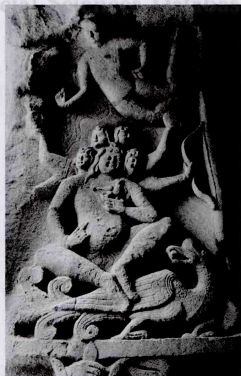
图三 云冈第8窟中的那罗延天 ②

(宇宙的根源)——那罗——之子。 ③ 《摩诃那罗衍那奥义书》(Mahānārāyaṇopaniṣad)则将那罗延与原人等同起来,吉藏的《中观论疏》中就提到:“那罗延此云生本,以其是众生之本故也。” ④ 《慧琳音义》中也有“那罗此云为人,延那此云生本,谓人生本即是大梵王也,外道谓一切人皆从梵王生故名人生本也”的记载。 ⑤ 在后来的文献中,那罗延作为一些大神的别名出现,主要指毗湿奴。特别是毗湿奴派的经典,如《那罗衍那奥义书》(Nārāyaṇopaniṣad),就将那罗延与毗湿奴(Visnu)——黑天完全等同起来,亦即《慧琳音义》所谓“那罗延,一名毗纽天”。 ⑥ 而佛教兴起以后,原为婆罗门教三大神之一的毗湿奴即那罗延,也被“收编”为佛教的护法神,成为“欲界中天”,并被认为是“此天多力”。作为护法神的那罗延天(神)王,在佛经中经常出现,东吴时支谦所译的《菩萨本缘经》(本文中使用的佛教文献等,除非特别指出,一般都载《大正藏》,不赘)是笔者所见最早一部提及那罗延天的汉译佛经,而魏晋时期也曾流行过一部名为《那罗延天王经》的佛经。 ⑦ 且据梅晓云等统计,在三国两晋南北朝隋唐五代宋元时期翻译的许多佛经中都能找到那罗延天,译经的地点则遍布大江南北。这些经典的传播,把那罗延神信仰深深地植入中国佛教文化里。 ⑧