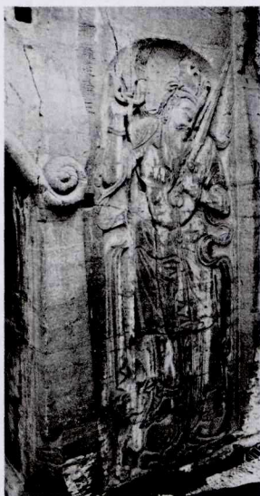
图一 灵泉寺大住圣窟门东侧的那罗延神王(拍摄于2013年)